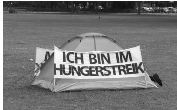
Protest gegen einen Gerichtsentscheid in Deutschland 2011