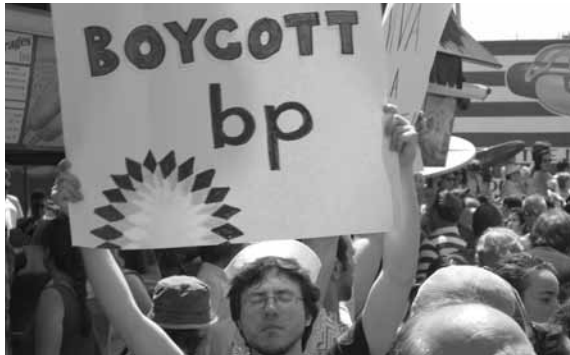
Boycottaufwurf gegen eine Ölfirma nach einer großen Ölpest 2010